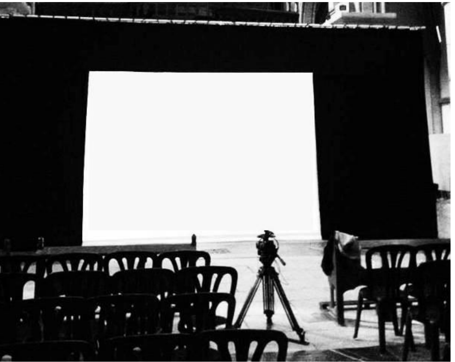
Boite noire pendrillons et frise selon taille