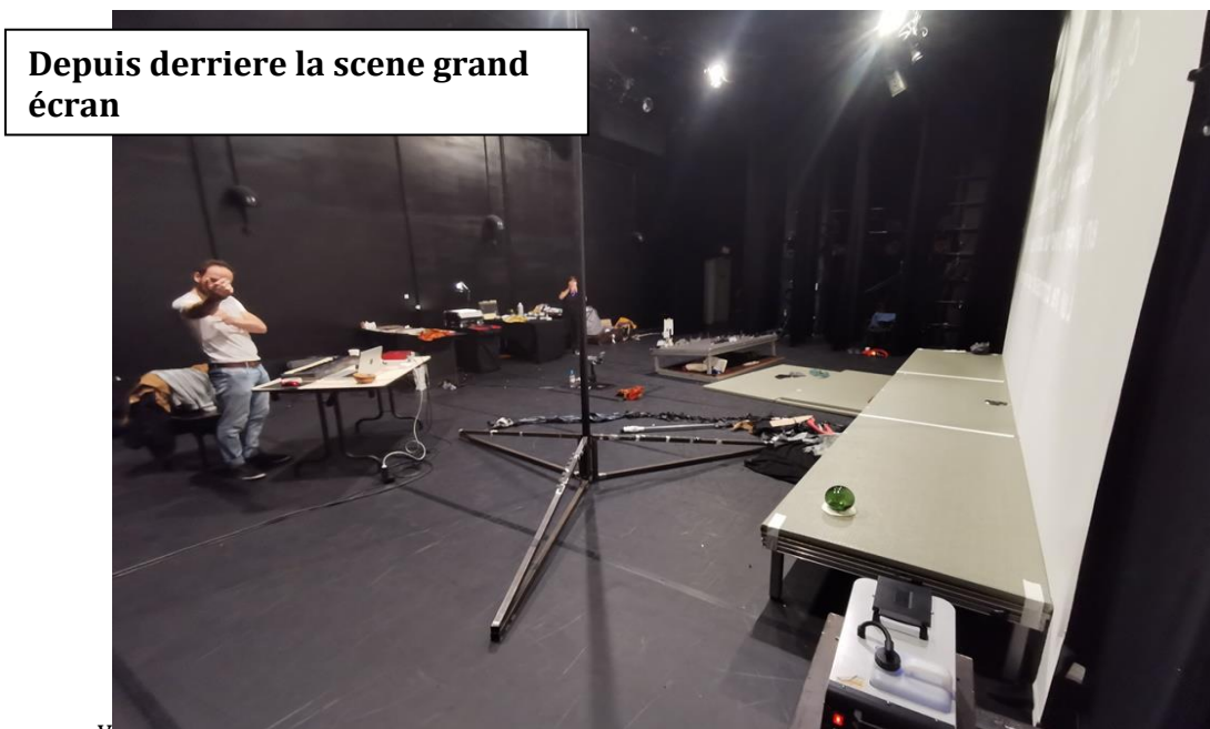
Depuis derriere la scene grand écran