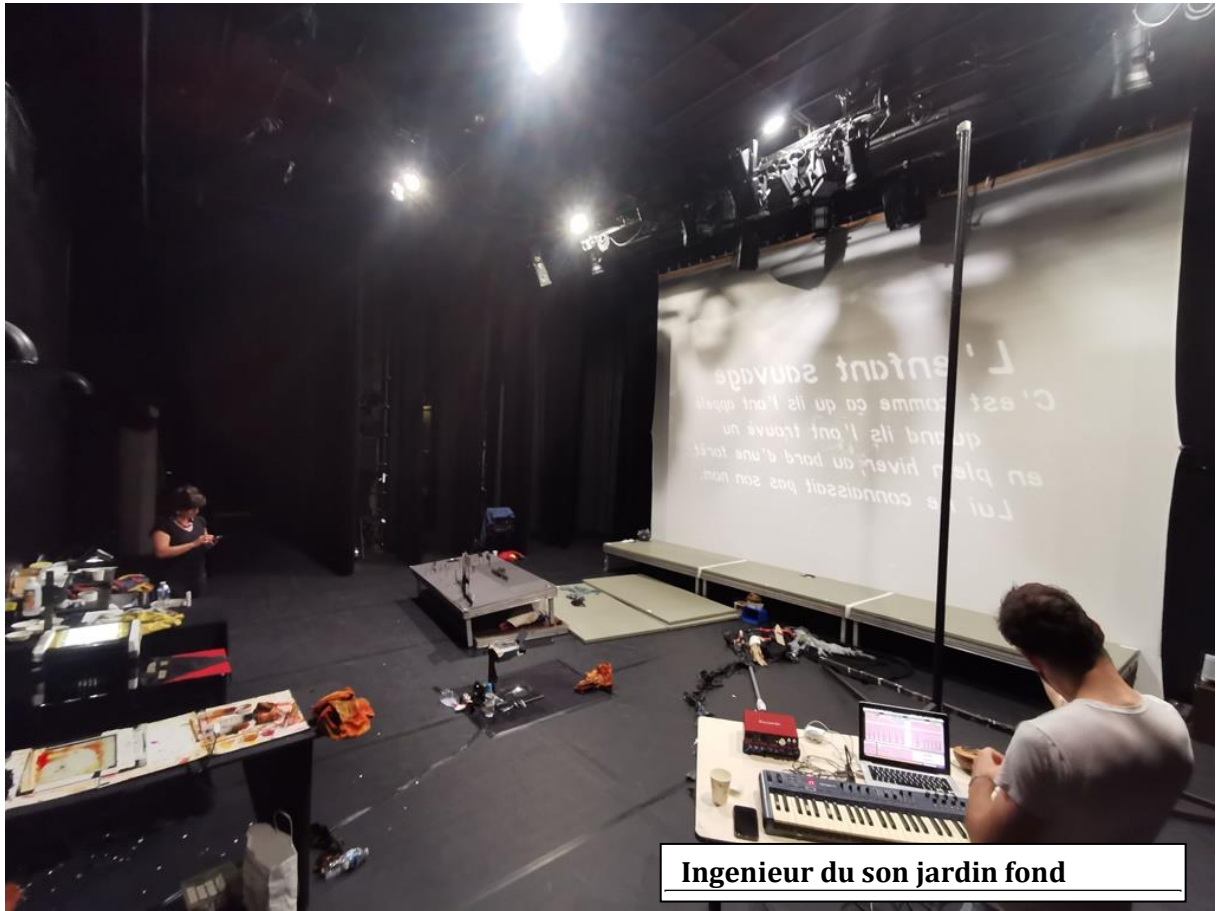
Ingenieur du son jardin fond