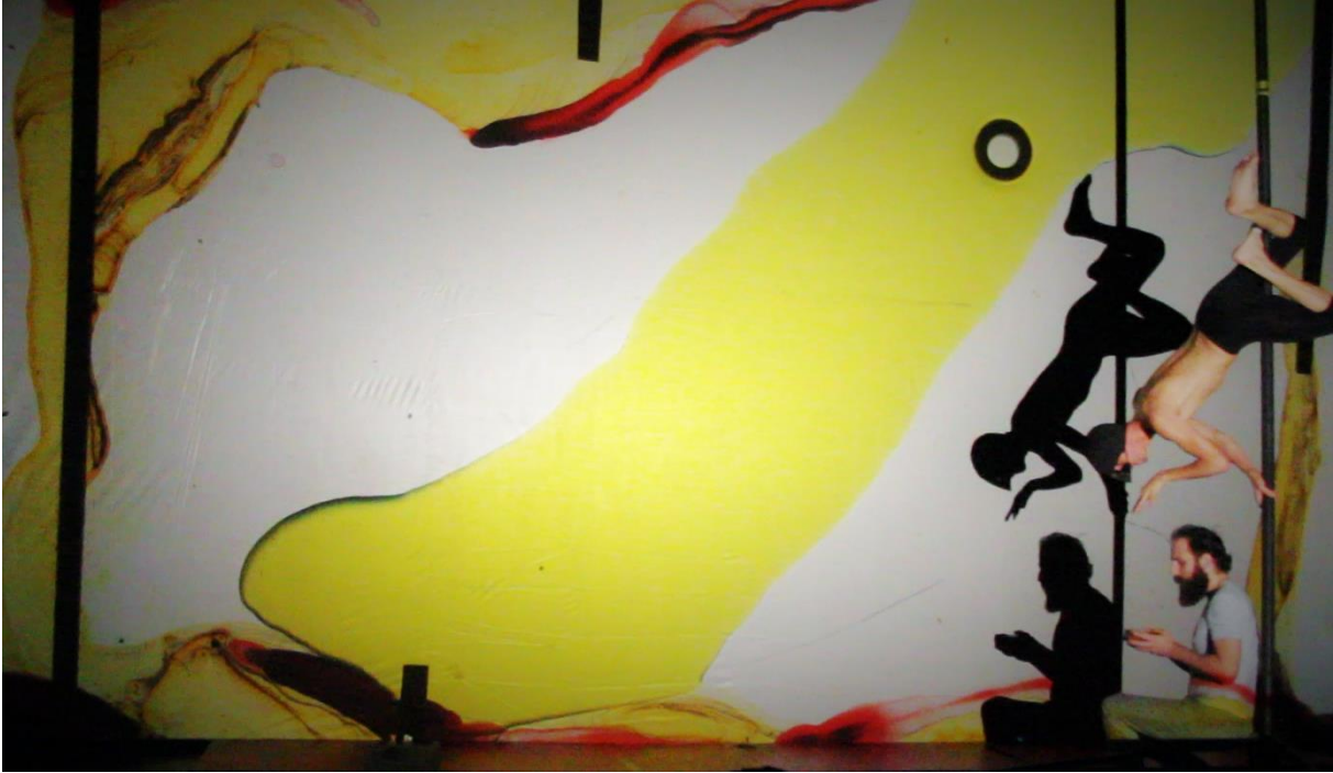
Vue de derriere pendant spectacle